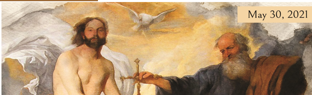
May 30, 2021